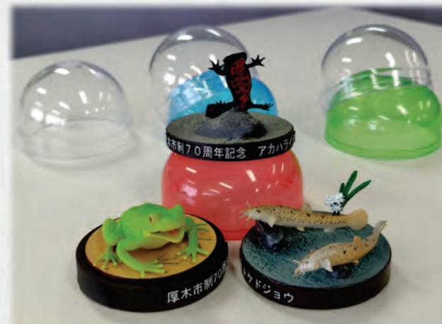
フィギュア(シュレーゲルアオガエル、アカハライモリ、ホトケドジョウ)