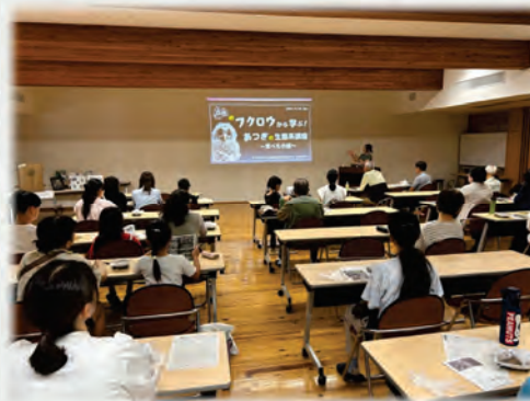
フクロウの生態について学ぶ様子