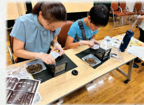
ペリットを使ったワークショップ