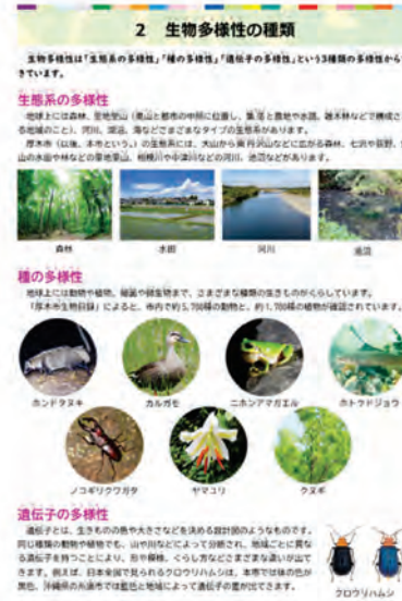
序章部分 (2、3 ページ)