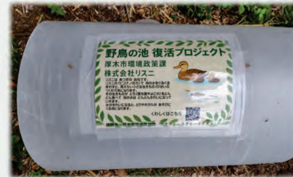
小規模池用小型循環装置