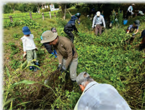
特定外来植物の駆除様子