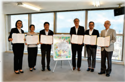
令和7年8月19日 協定締結の様子