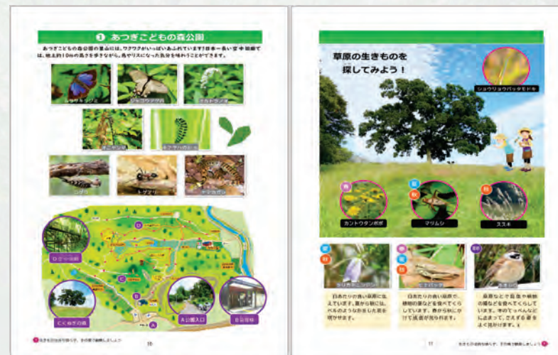
あつぎこどもの森公園 (戦略紹介ページ)