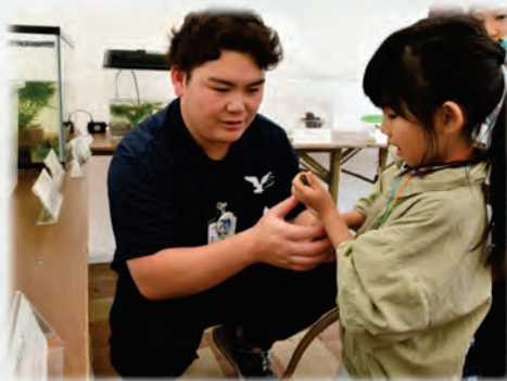
へびを触っている様子