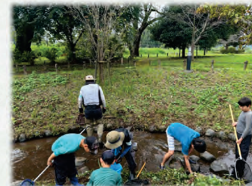
アメリカザリガニの駆除様子