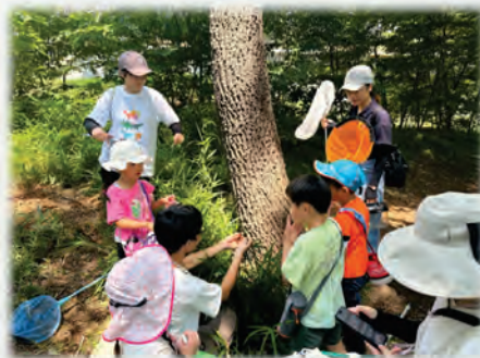
農大敷地内での生きもの探し