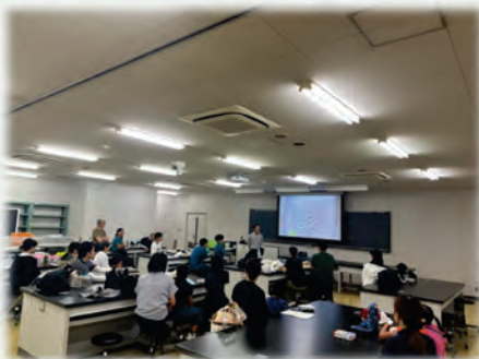
生物多様性についての座学