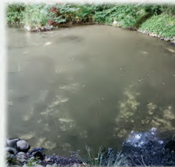
膜が張ってあるような池