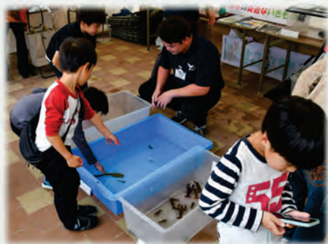
アメリカザリガニやウナギを触っている様子