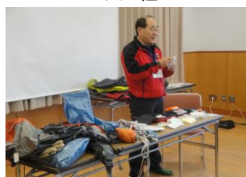
↑ 救急道具の紹介 ← ビデオ上映