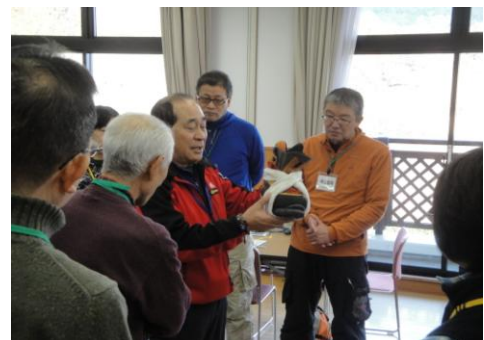
アイゼンを忘れた時は、タオルで代用！