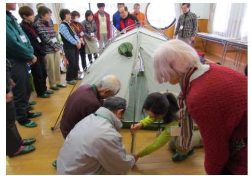
テントもみんなで協力し、立ててみました。