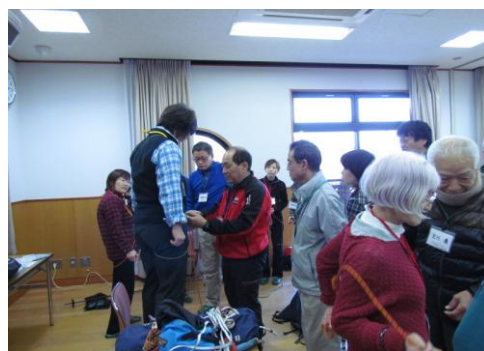
3人1組でロープワーク。