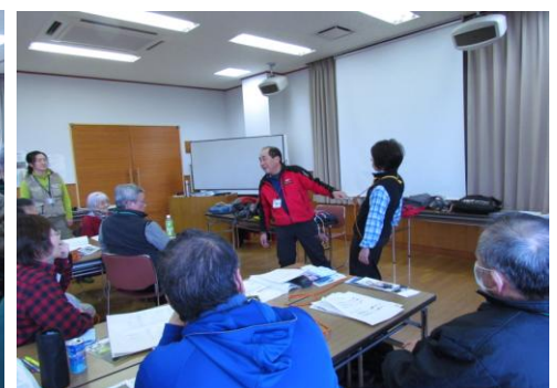
斜面で滑ってもこれで助ける！