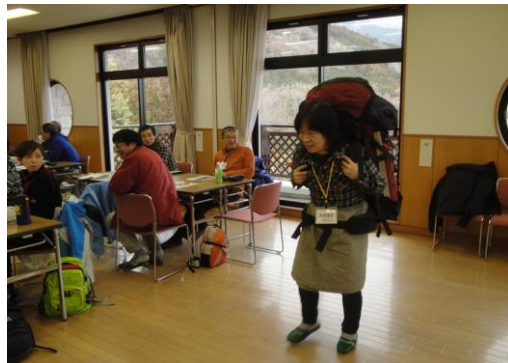
冬山用のザックを背負ってみよう！