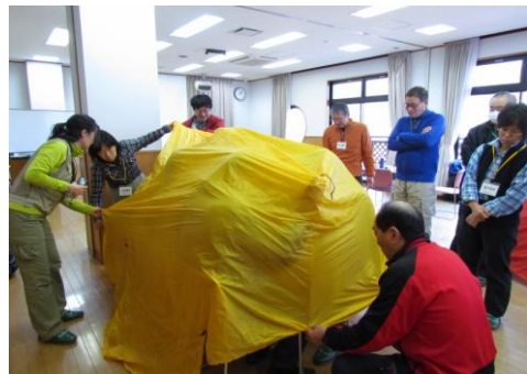
緊急時に活躍するツェルト。2人用でもみんなで温まることができる！